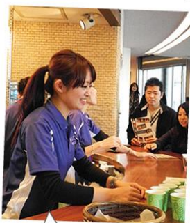
ドリンクコーナー