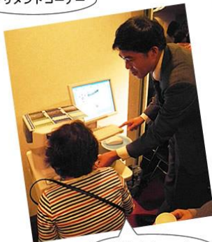
めだしなみコーナー

そのほか、わかさ生活の社会貢献活動を紹介するブースや、 “めだしなみ”コーナー(角膜内皮のチェック)など、 多くの人に楽しんでいただけました。