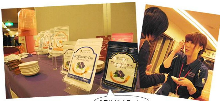
サプリメントコーナー

休憩時間には、それぞれのブースも賑わいを見せました。 サプリメントブースでは、ミュージカルで瞳について学んだことで、スタッフにたくさんの健康相談が寄せられました。 また、ブルーベリー味が大好きなお子さまもたくさん来てくれました！